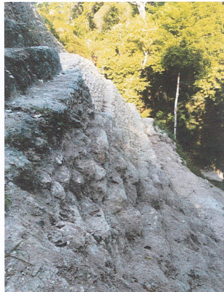
Edificio B-24, proceso de remoción de material suelto en esquina noroeste.