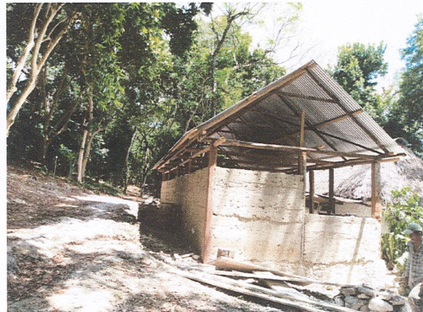
Proceso de rehabilitación de dormitorios, muros de piedra y mezcla hecha a base de cal.