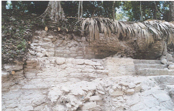
Edificio B-17, proceso de restauración de arquitectura expuesta