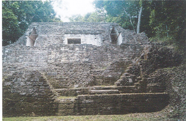
Edificio 375, fachada sur